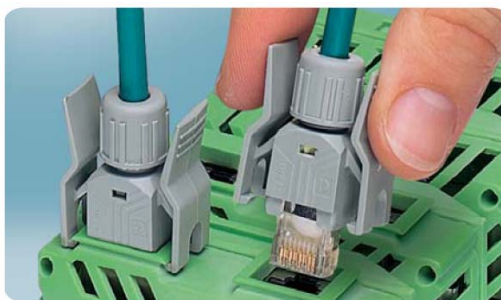
IP20対応RJ45コネクタは、振動や機械的ストレスに強い構造でネットワークの配線をより確実にします。