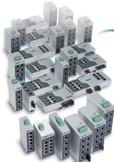
■アンマネージドスイッチ各種