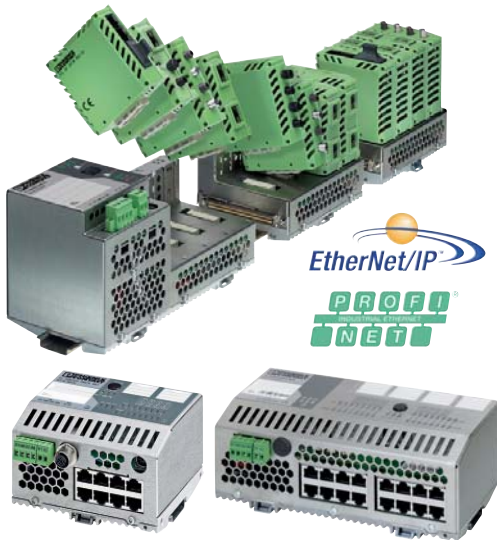
■マネージドスイッチ各種