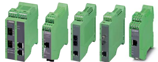
■光コンバータ・シリアルコンバータ