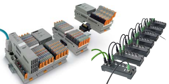
■イーサネットリモート I/O 各種